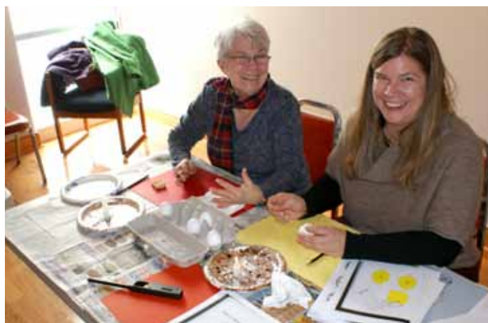
Pysanka Workshop-the UMA had to add extra classes because of the demand. We had nearly 75 students this year.