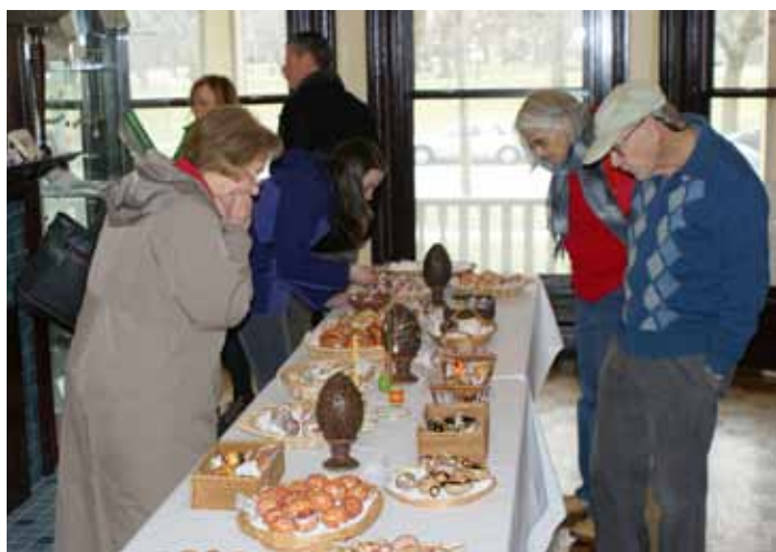
Shopping at the 20th Annual UMA Easter Bazaar