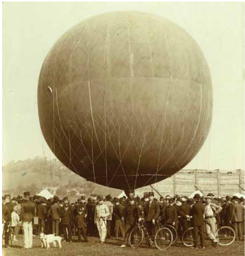
Hot air balloon launch in Peremyshl, 1906; The balloon, bicycles and the camera which took the photograph were the most up-to-date technologies at the "Gateway to the 20th Century, 1900-1914," the theme of our next exhibit.

Join us for the opening reception on June 14th at 6pm