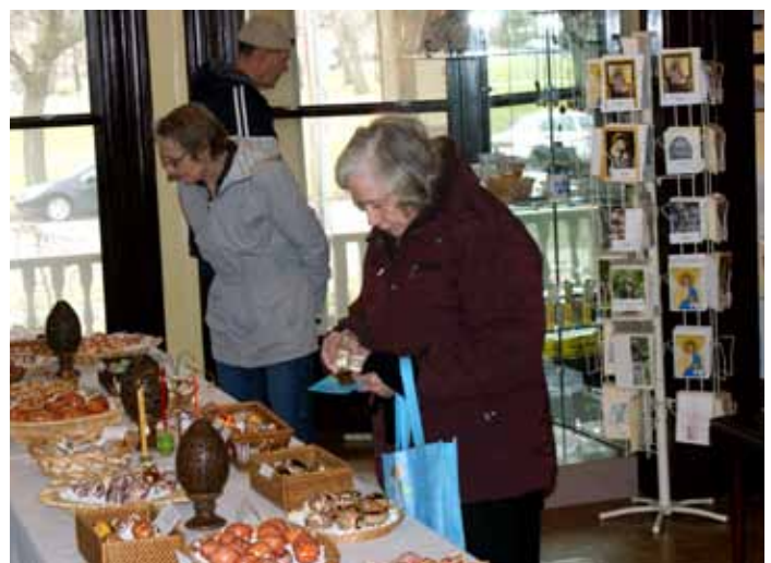
Visitors at the 2013 UMA Easter Bazaar selecting pysanky for their Easter baskets